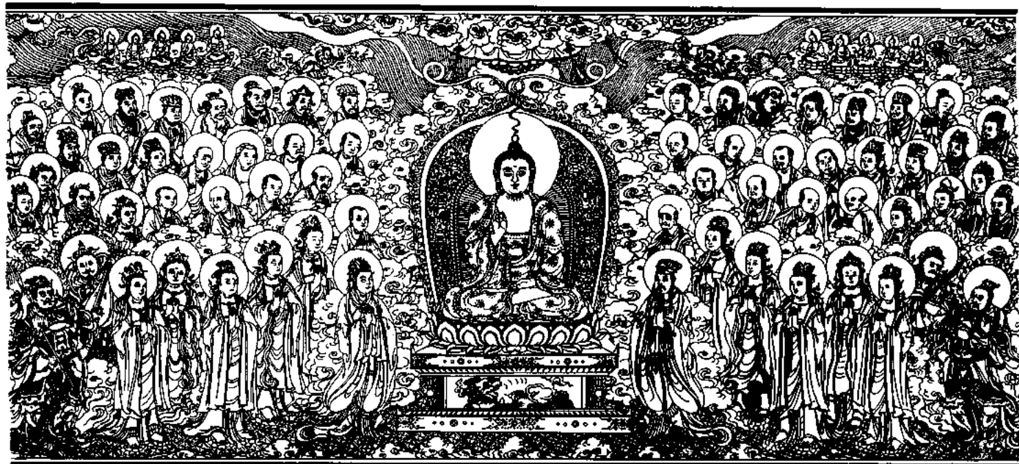
清刻龍藏佛說法變相圖