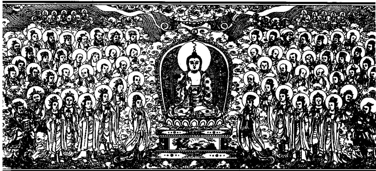
清刻龍藏佛說法變相圖